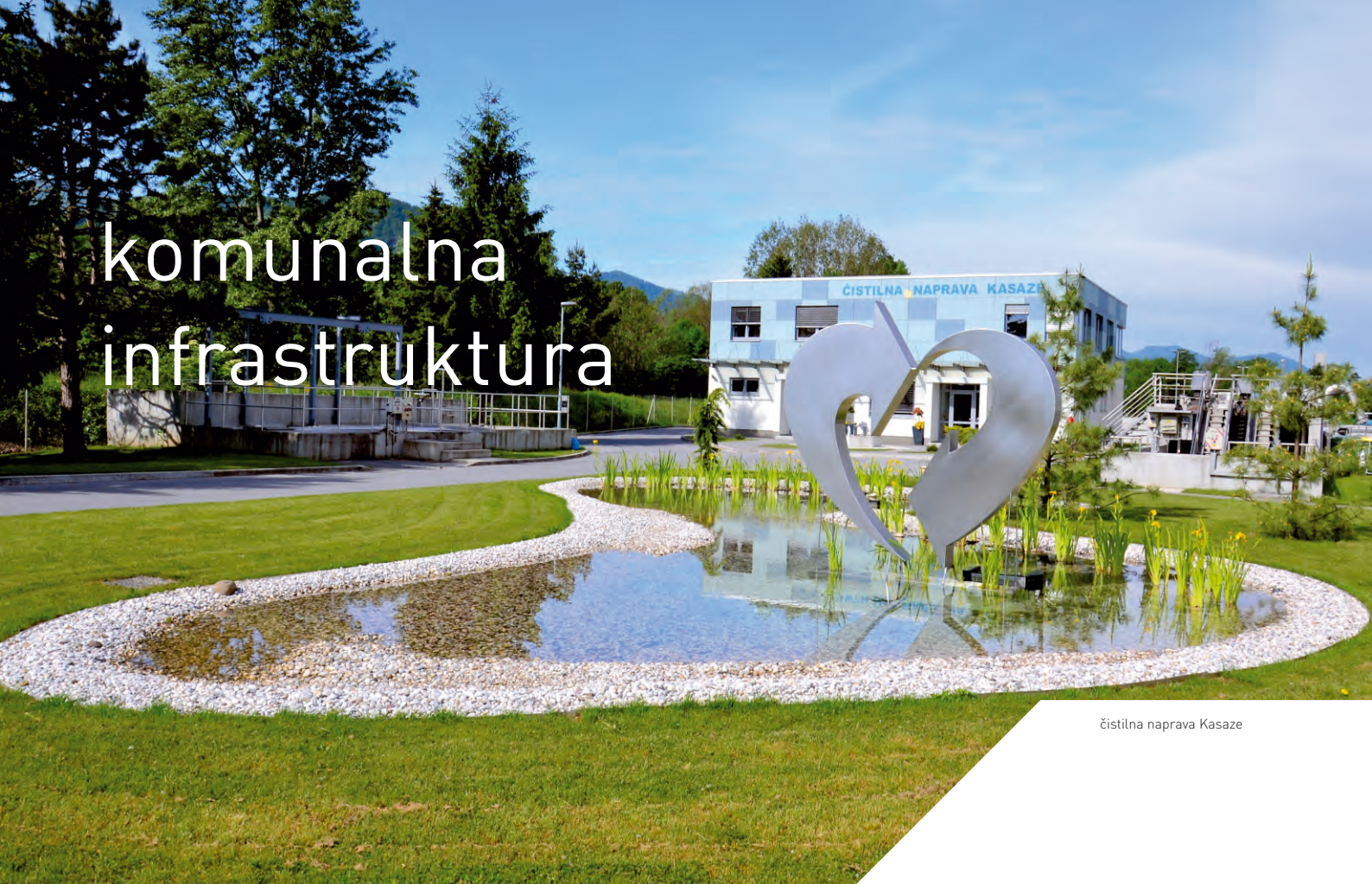
čistilna naprava Kasaze