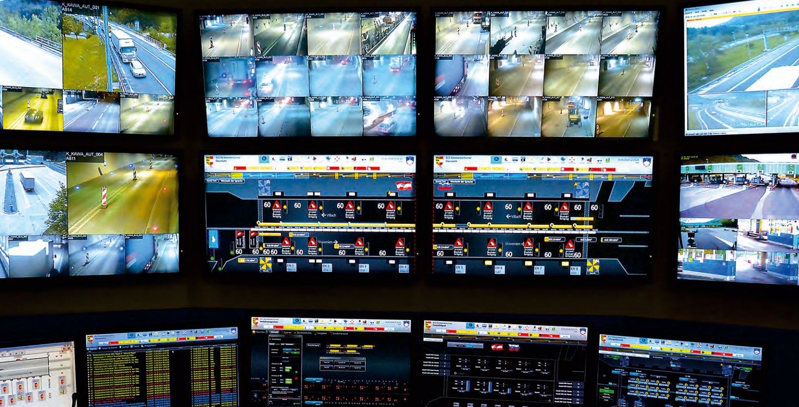
predor Karavanke - nadzorni center Hrušica