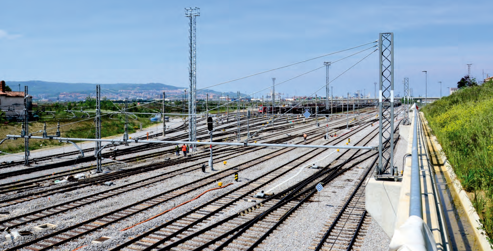
glavna pristaniška postaja Koper