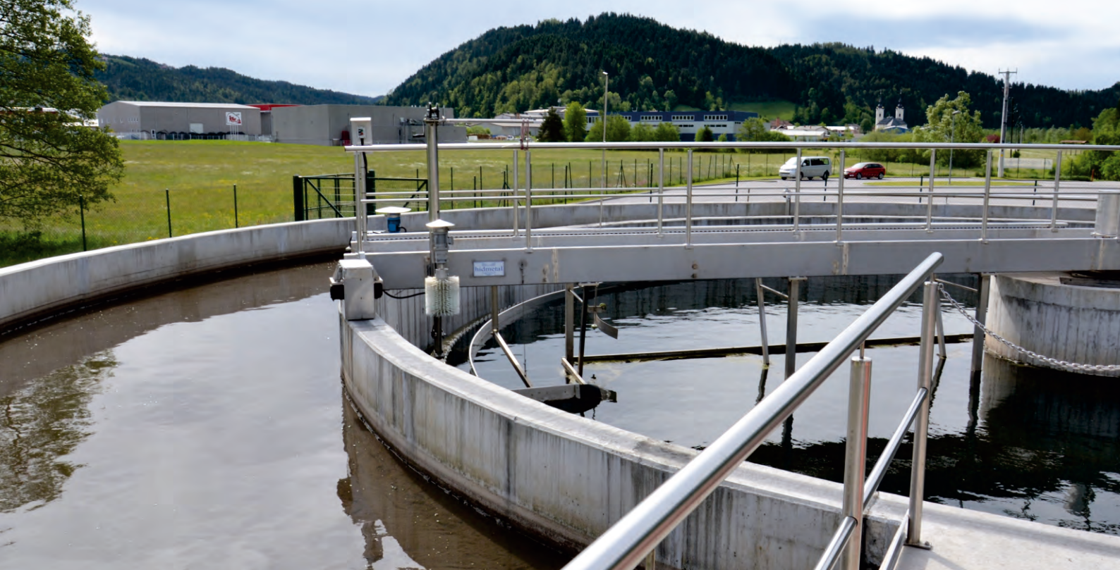
čistilna naprava Žiri