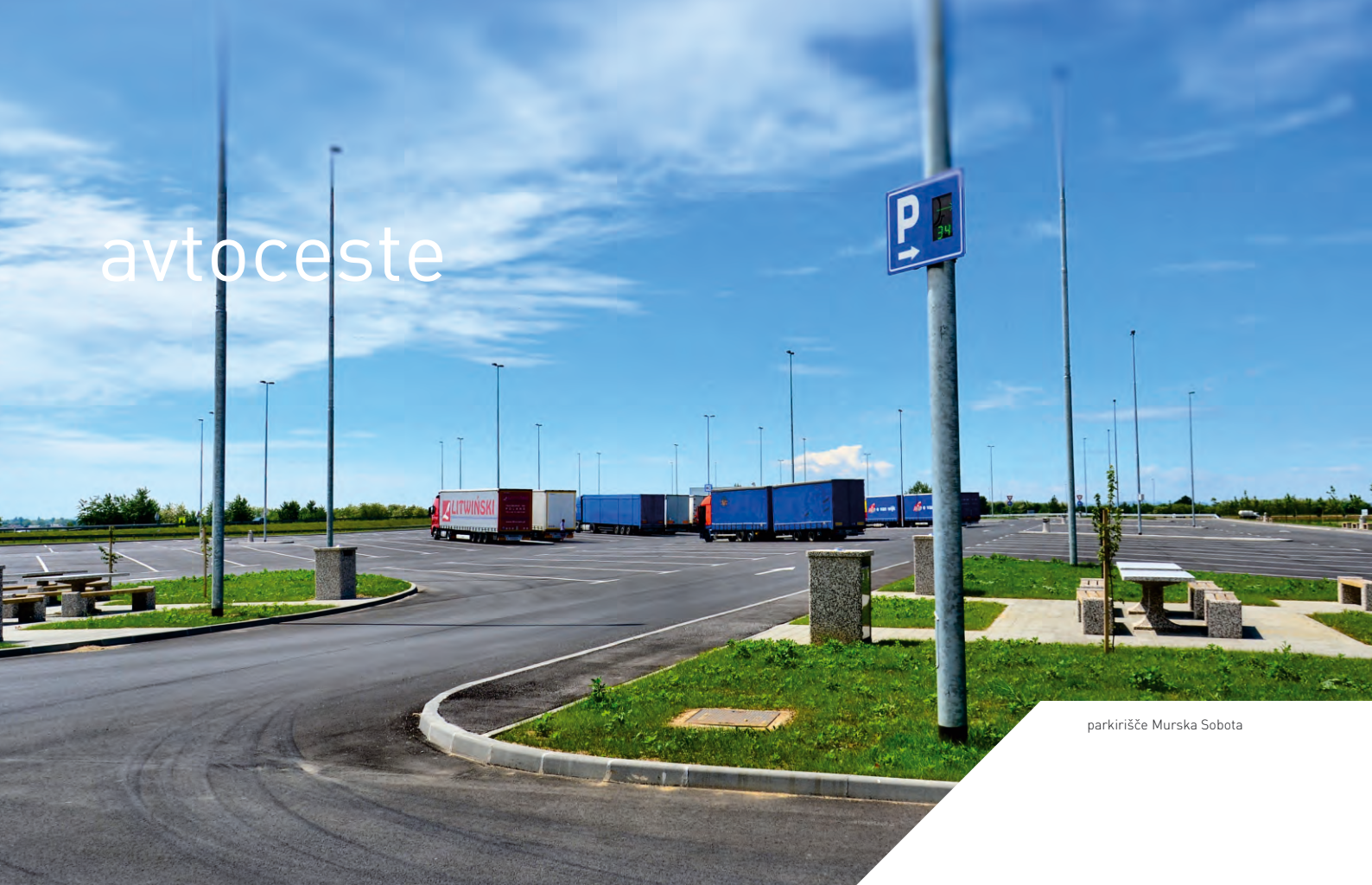
parkirišče Murska Sobota

DRI upravljanje investicij opravlja celovite in specializirane svetovalne, inženirske in raziskovalne storitve pri načrtovanju, umeščanju v prostor in gradnji avtocest v Republiki Sloveniji ter dela v zvezi z rednim vzdrževanjem ter obnovitvenimi deli na zgrajenem omrežju cest v upravljanju DARS-a.