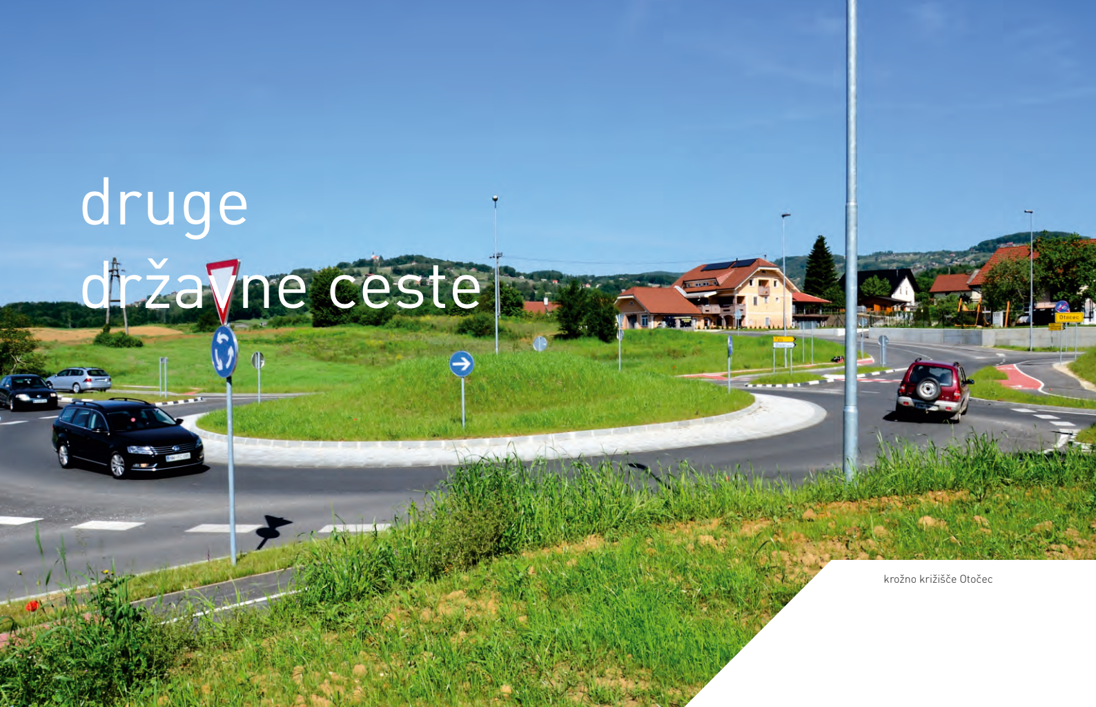
krožno križišče Otočec

V letu 2013 smo kot konzultant in inženir izvajali strokovne storitve pri novogradnjah, modernizacijah, rekonstrukcijah, ureditvah, preplastitvah cest in objektov, sanacijah plazov, brežin in zidov ter storitve iz sklopa rednega vzdrževanja v letnem in zimskem času na celotnem omrežju državnih cest.