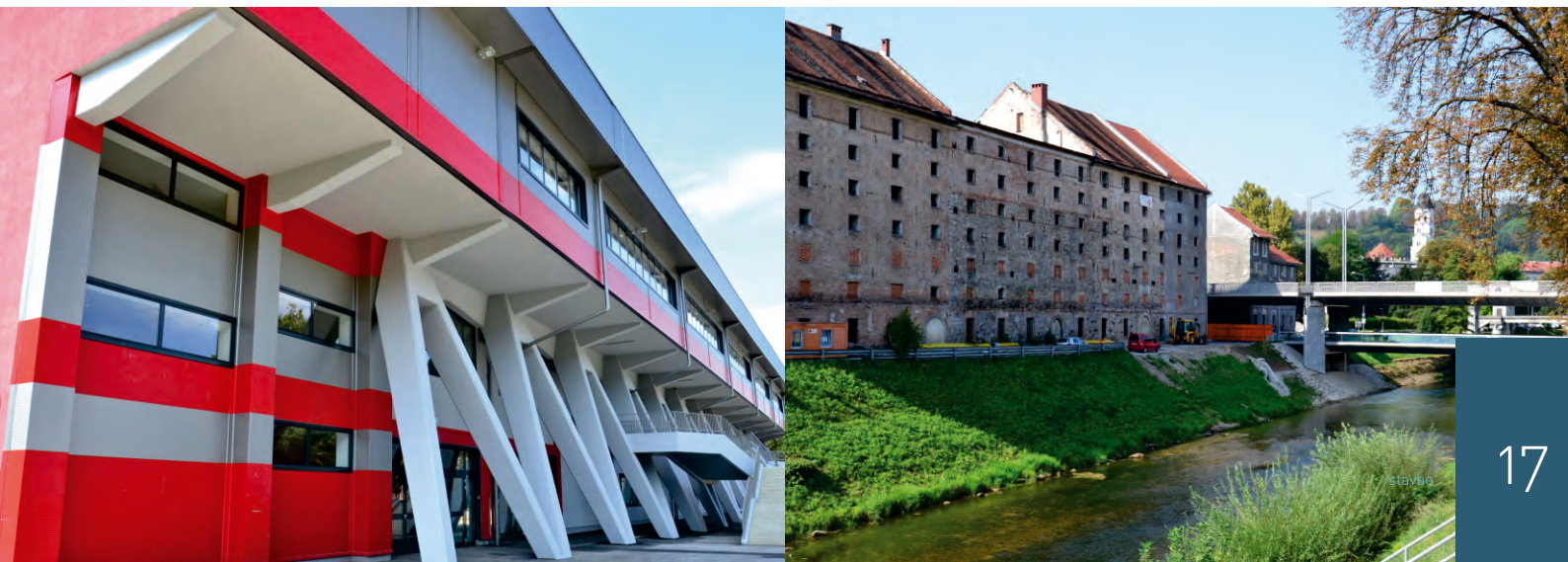
Cukrarna v Ljubljani