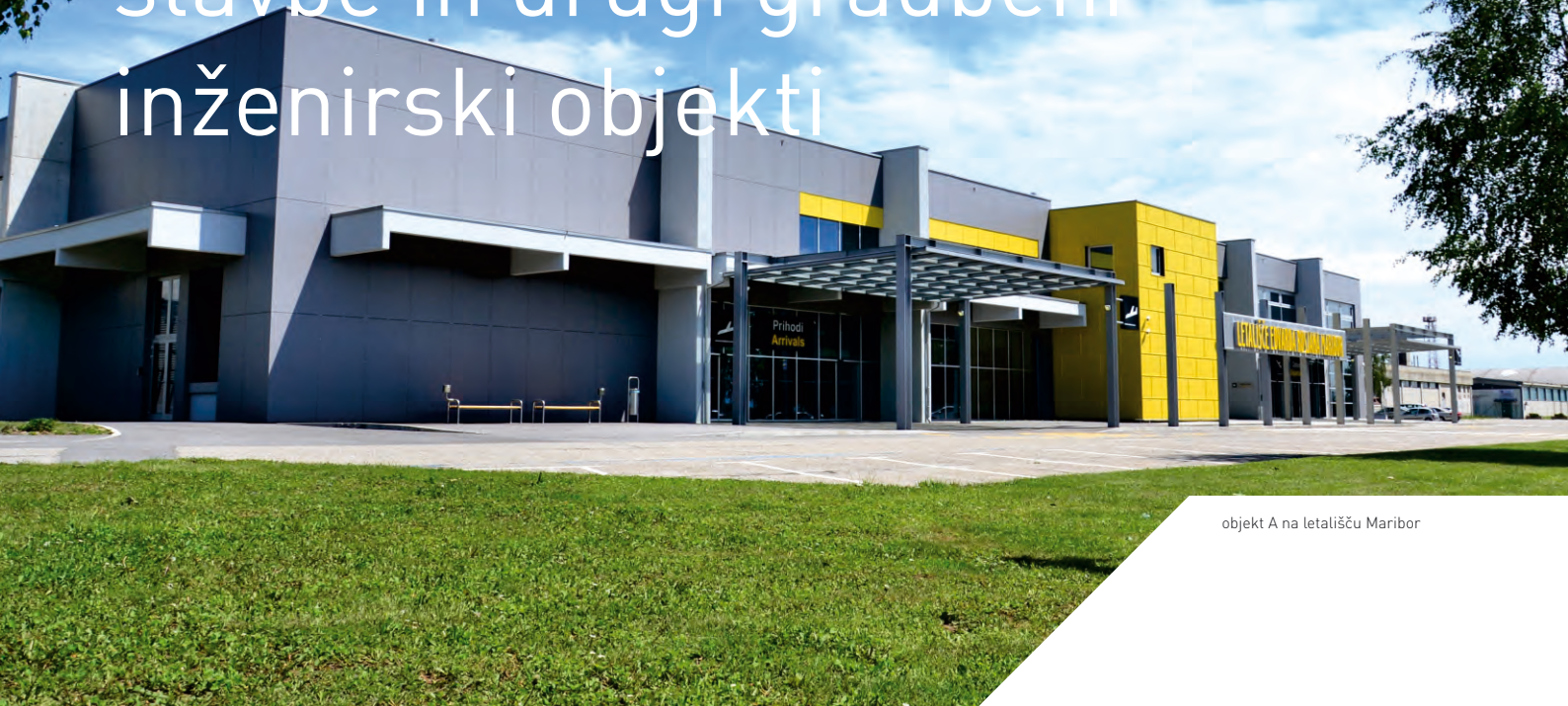
objekt A na letališču Maribor