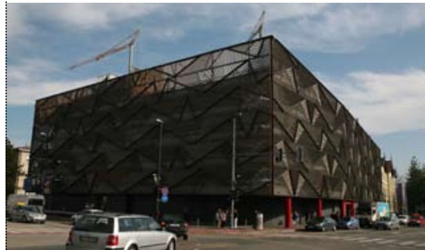
Garažna hiša Šentpeter

DDC svetovanje inženiring, d.o.o. je tudi v letu 2006 izvajal strokovni nadzor pri gradnji stavb, pripravi investicijske dokumentacije in revidiranju projektov. Glavna naročnika sta bila Kranjska investicijska družba d.o.o. in Ministrstvo za javno upravo, Direktorat za investicije, nepremičnine in skupne službe državne uprave.