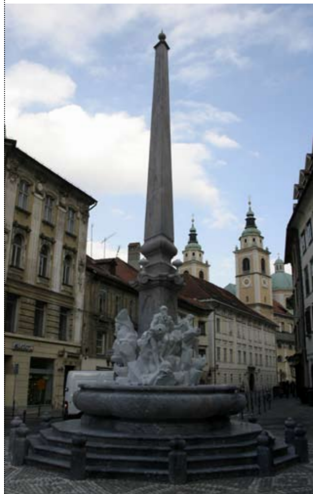
Robbov vodnjak v Ljubljani