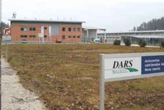
Avtocestna baza Novo mesto