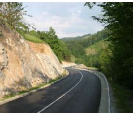
Regionalna cesta Gorenja vas - Trebija