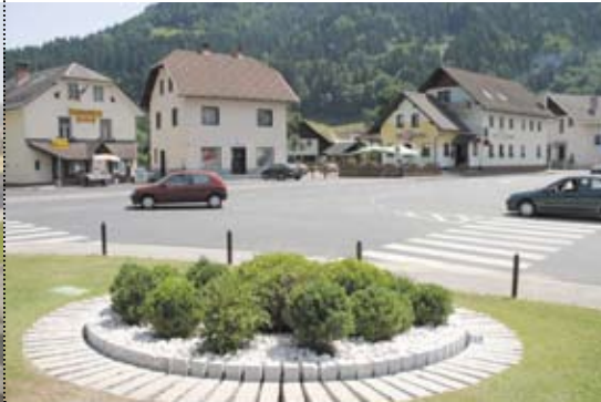
Križišče Češnjica v Železnikih na regionalni cesti Češnjica - Škofja Loka