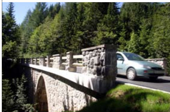
Regionalna cesta Kranjska Gora - Vršič