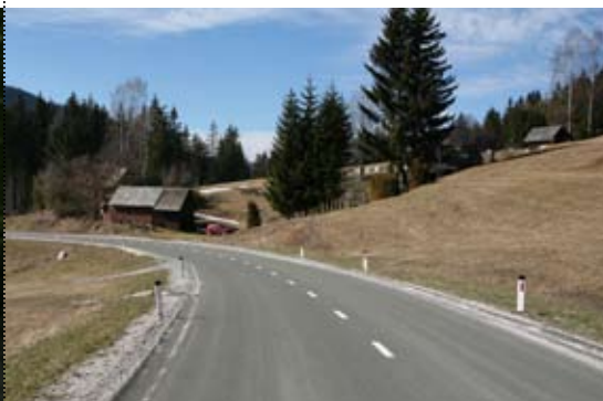
Regionalna cesta Črna - Šentvid