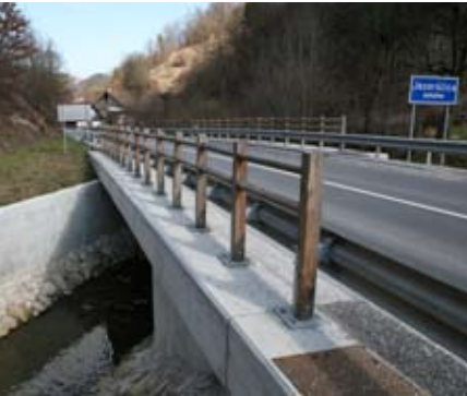
Most čez Jezerščico v Vodicach