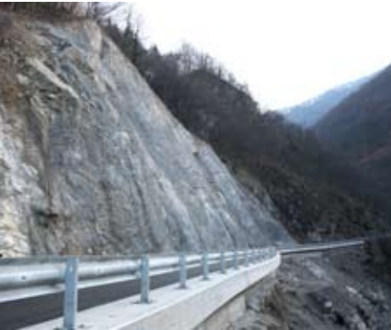
Regionalna cesta Kneža - Podbrdo