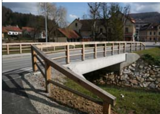
Most čez Voglajno v Gorici pri Slivnici