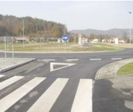
Krožišče v Dolskem na glavni cesti Šentjakob - Ribče