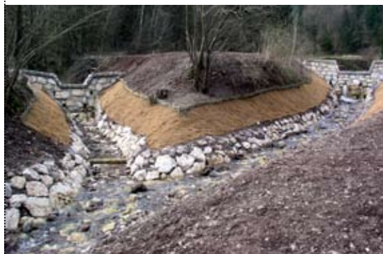
Desni pritok Sopote v Žebniku