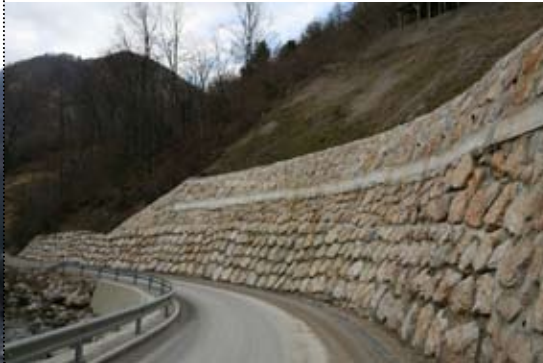
Regionalna cesta Boštanj - Planina