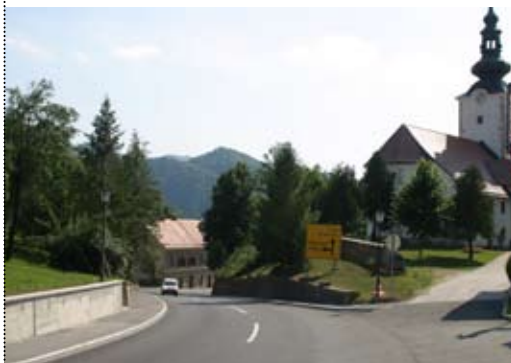
Regionalna cesta Bistrica - Bizeljsko