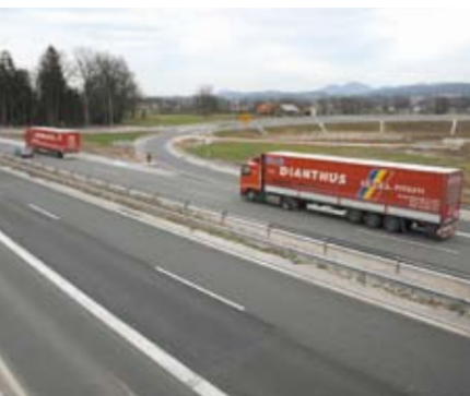
Avtocestni priključek Ljubecna