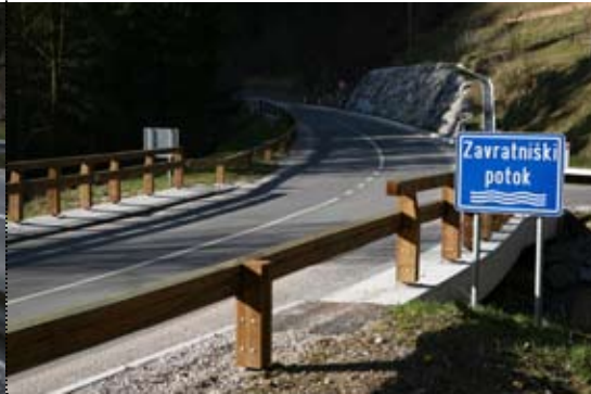
Most čez Zavratniški potok v Iglji